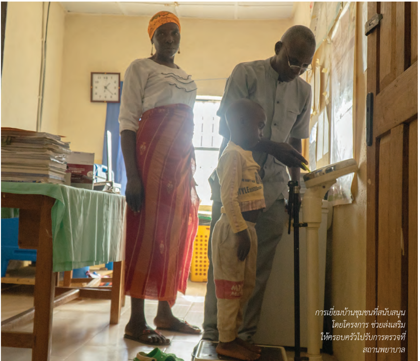
การเยี่ยมบ้านชุมชนที่สนับสนุน โดยโครงการ ช่วยส่งเสริม ให้ครอบครัวไปรับบริการตรวจที่ สถานพยาบาล

เพื่อจัดการกับปัญหาช่องว่างนี้ โครงการริเริ่มสร้างสรรค์ด้วยทุนสนับสนุนของ Programs of Scale จึงได้จัดให้มีการฝึกอบรมสำหรับเจ้าหน้าที่สาธารณสุขในด้านสูติศาสตร์ฉุกเฉินและการดูแลทารก