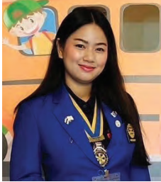
โดย นย.นิवास ศรีษมภู สโมสรโรตารียะลา